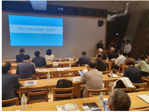
동경공업대학 파견학생(KAIST) 발표