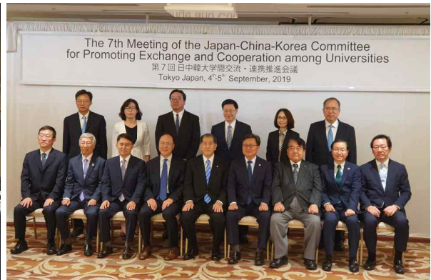
본 회의 3국 전문가위원 단체사진