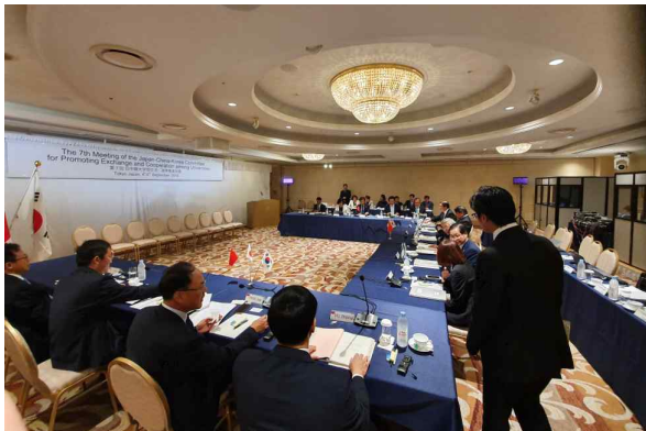
제7차 고등교육교류전문가위원회 본회의