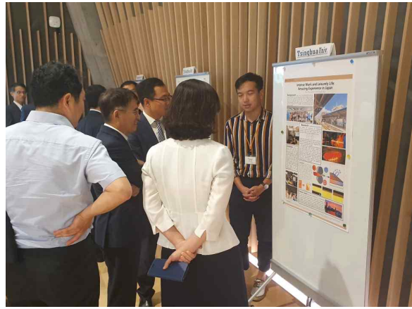
동경공업대학 파견학생 프로그램설명