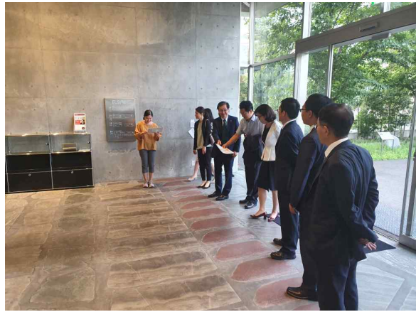
동경공업대학 시설 견학