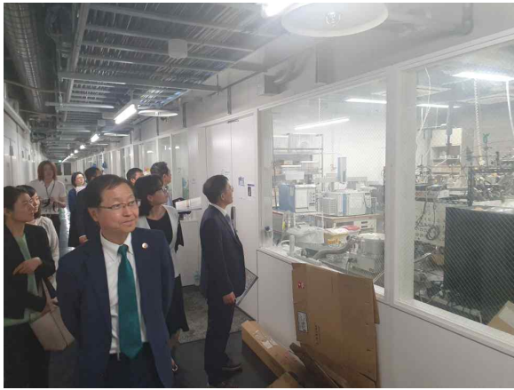
동경공업대학 시설 견학