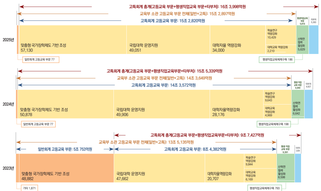
[그림 1] 2023~2025년 교육부 소관 고등교육 부문 및 고등·평생교육특별회계 예산 규모

■ 일반회계 ■ 고특회계(고등교육 부문/평생·직업교육 부문/타부처) (단위: 억원)